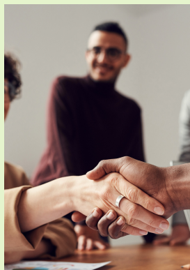
DISPOSITIFS Page 6