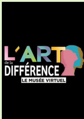
ACTUALITÉS Page 3 et 4