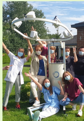
ETABLISSEMENTS Page 5