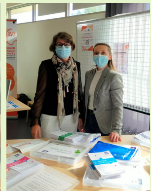
PROJETS Page 7