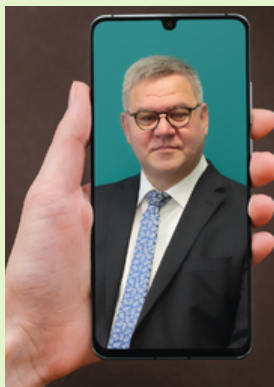
EDITO Page 2

APPEL A INITIATIVES CITOYENNETE Découvrez en images les 4 projets lauréats ! Page 3